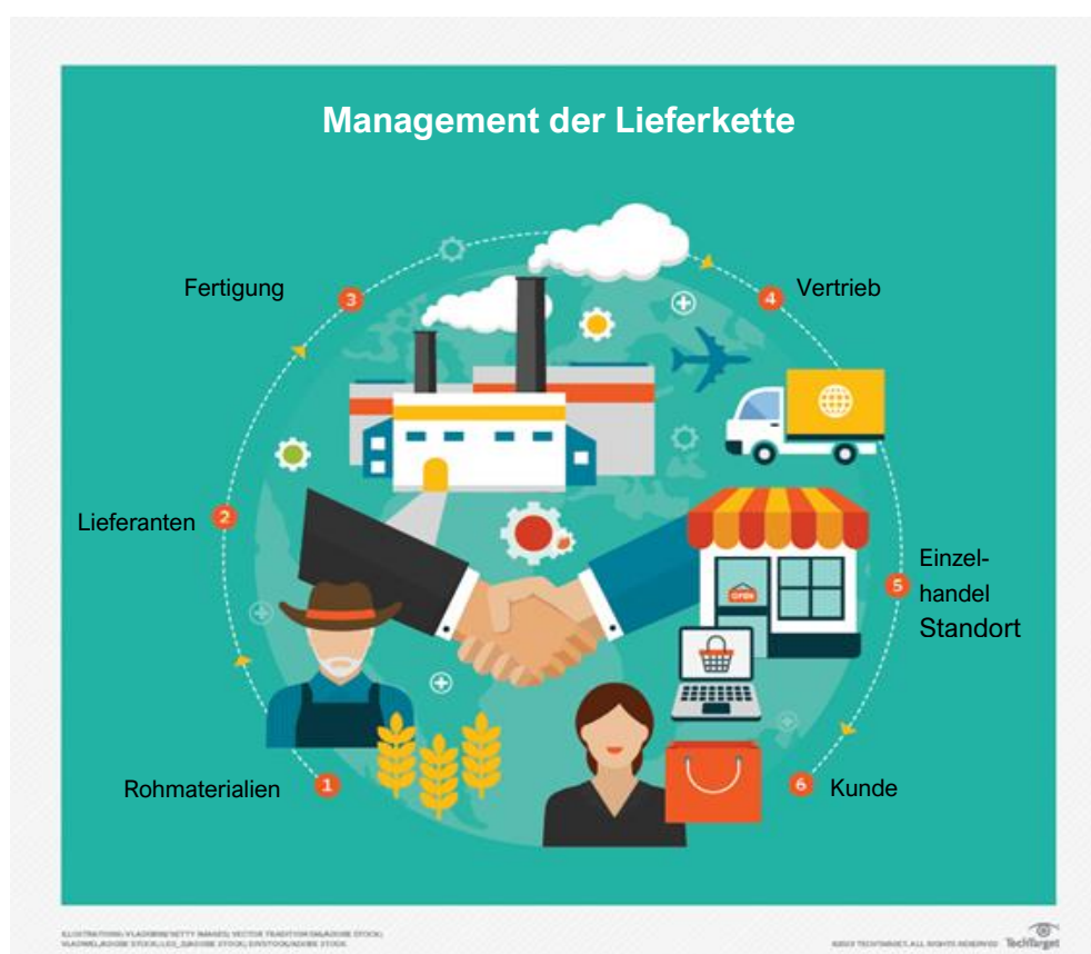
Abb. 2: Ein Beispiel für ein Lieferkettenmanagement (2019, TechTarget.All)

Die einfachste Version einer Lieferkette umfasst ein Unternehmen, seine Lieferanten und die Kunden dieses Unternehmens. Ein Beispiel wäre: Rohstoffproduzent, Hersteller, Vertriebshändler, Einzelhändler und Einzelhandelskunde. (2019, TechTarget.All)